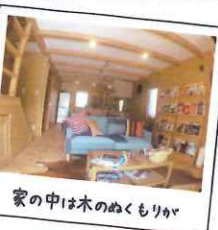
家の中は木のぬくもりが